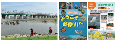
「憩いの風景」環境学習副読本「ようこそ多摩川へ」

当社は、1974年設立の多摩川流域の環境保全に取り組む「とうきゅう環境浄化財団」（現 東急財団）への支援を行っています。同財団では流域における環境浄化・改善に関する調査研究やその助成、行政への協力、広報活動などを実施してきました。また、地域の子どもたちに自然や川のめぐみに対しての知識や親近感を持ってもらうことを目的に、多摩川流域の小学校などに向け環境学習副読本を配布することで、未来の人材育成にも貢献しています。