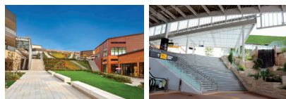
公園へとつながるパークプラザ 南町田グランベリーパーク駅

「南町田グランベリーパーク」（東京都町田市）は「まちのぜんぶが“パーク”となる」をコンセプトに、町田市と連携・共同して、駅・商業施設・都市公園を含む約22haものエリアを一体的に再整備し、まちびらきをしました。商業施設の外構部に花や実のなる樹木などを植栽することで、鳥や昆虫類の生息を促し、隣接する鶴間公園という地域資源やグリーンインフラも生かした、豊かな自然とにぎわいと融合を実現したまちづくりとなっています。