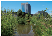
ビオトープ「めだかの池」

「二子玉川ライズ」（東京都世田谷区）屋上では、周辺の植生を施設内に再生することで、多摩川と国分寺崖線をつなぐ生物ネットワークの維持・保全に取り組んでいます。ビオトープには数百匹のミナミメダカ、ドジョウ、モツゴやカメなどが生息し、多摩川固有の水辺環境を再現し、その環境を地域で活動する方々と整備しています。また多摩川流域にも生息し、絶滅危惧種であるカワラノギクの保全を行っており、開花の季節には地域の環境学習の場としても機能しています。