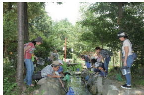
四季折々の季節に合わせた里山体験プログラム

体験を通して「自然と共生する暮らし」について考え、「今、自分にできること」を見つけ、一歩踏み出し行動に移すきっかけを提供している。